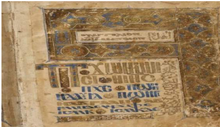
Pic. No. 01, Manuscript-Naskh- and-Coptic